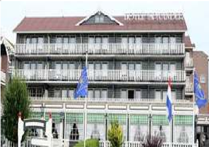
Hotel Spaander Haven 15 Volendam